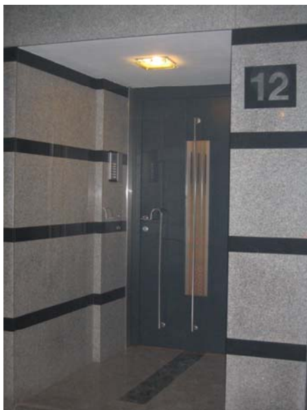
Външна врата към бул. Цар Освободител Main door to Zar Osvoboditel-Blvd.

Централното отопление на офиса е дублирано с климатик, подовите са гранитогрес и дъбов паркет, осветеността на някои от помещенията е подобрена със стъклени преградни стени. Стълбищата са от гранит. Санитарните помещения са обзаведени с луксозна санитария.